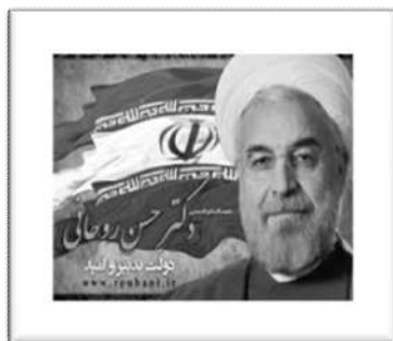
ریاست محترم جمهوری:

چراغ کار و اشتغال در سراسر ایران عزیز باید همواره تابناک باشد