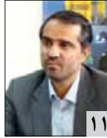
مدیر کل استان خراسان رضوی در گفت و گو با تأمین: درصد ارائه خدمات بهتر به بیمه شدگان هستیم