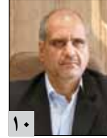
مدیر درمان استان خراسان رضوی در گفت و گو با تأمین: سیستم HIS در بیمارستان های تأمین عملیاتی می شود

۳ ساماندهی حوزه سلامت با کارت هوشمند محقق می شود