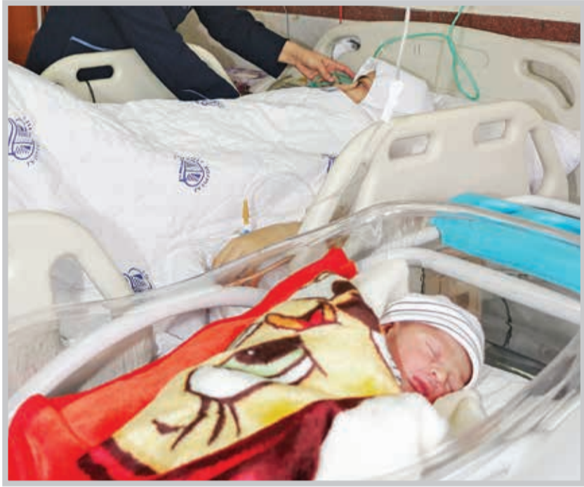
یکی از شرایط اصلی پرداخت غرامت دستمزد ایام بیماری این است که استراحت پزشکی بیمه‌شده از هنگام اشتغال یا مرخصی استحقاقی بیمه‌شده شروع شده باشد.

آیا مبلغ غرامت دستمزد ایام بارداری برای استراحت‌هایی که از سالی به سال بعد ادامه می‌یابد یا توجه به درصد افزایش دستمزد بیمه‌شدگان افزایش می‌یابد؟