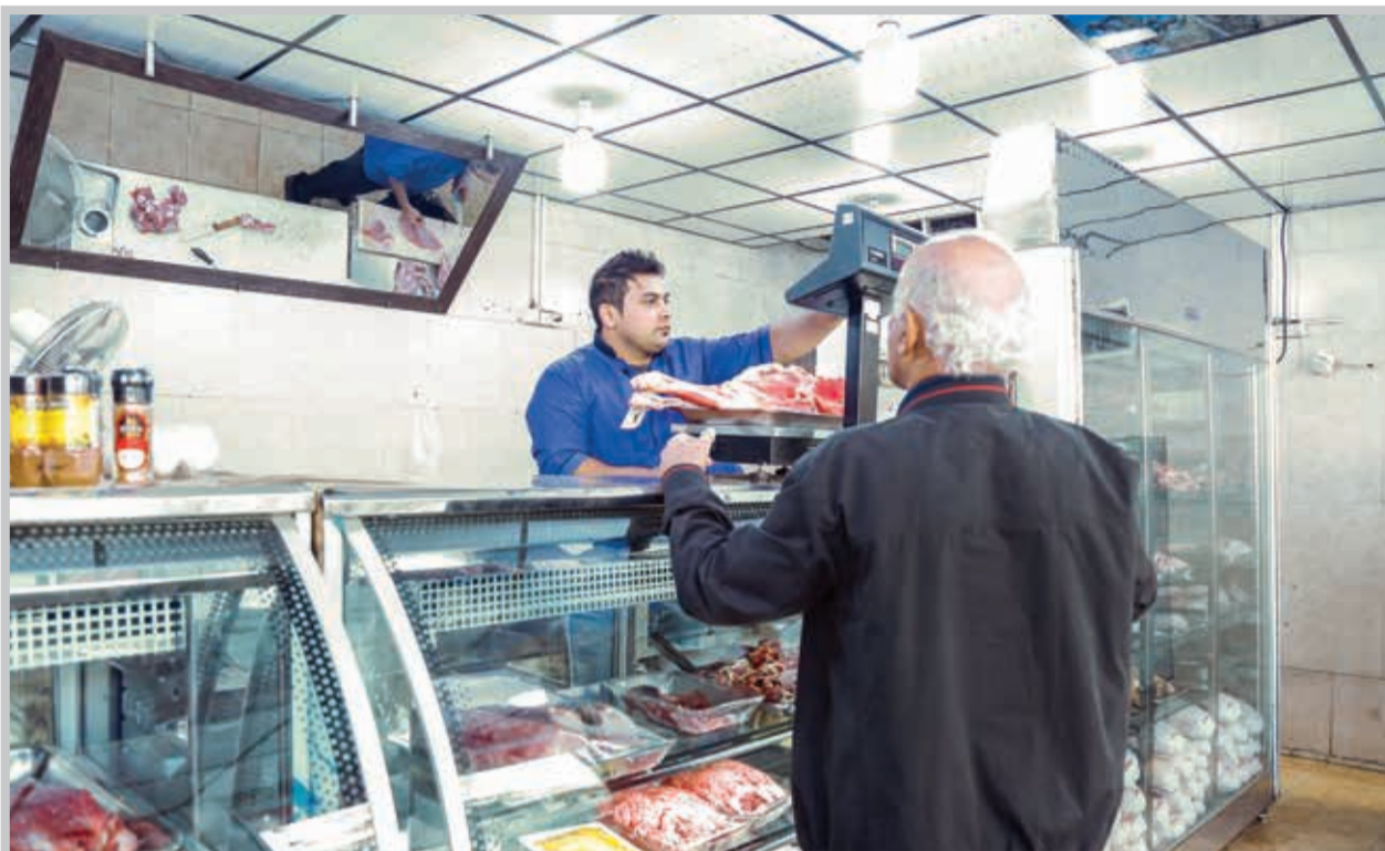
تعریف دستمزد مقطوع برای برخی مشاغل منجر به افزایش ۱۰ تا ۳۰ درصدی حق بیمه این شغل‌ها شده است.