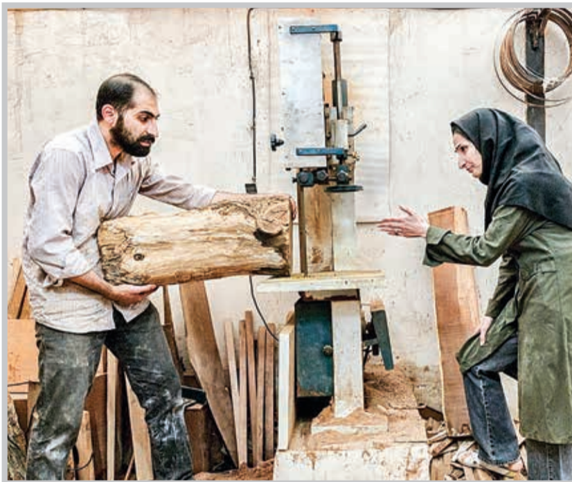
در صورتی که کارفرمایان از ارسال لیست پرداخت حق بیمه ظرف مهلت مقرر خودداری کنند ملزم به پرداخت جریمه نقدی به میزان ۱۰ درصد مبلغ حق بیمه خواهند بود.

کارگاه‌های دارای معافیت سهم کارفرما از پرداخت حق بیمه که صرفاً حق بیمه سهم بیمه‌شده (۷ درصد دستمزد بیمه‌شدگان) و بیمه‌ی بیکاری (۲ درصد دستمزد بیمه‌شدگان) را پرداخت می‌کنند، چنانچه لیست حق بیمه کارکنان خود را ظرف مهلت مقرر ارسال نکنند یا به‌رغم ارسال لیست حق بیمه در مهلت مقرر، حق بیمه مربوط به آن را خارج از مهلت مقرر پرداخت کنند، علاوه بر تعلق جریمه تأخیر ارسال لیست (۱۰ درصد حق بیمه ماه) یا جریمه تأخیر پرداخت حق بیمه (۲ درصد حق بیمه بابت هرماه تأخیر) معافیت سهم کارفرما از پرداخت حق بیمه بابت ماه موردنظر نیز برای آنان حذف می‌شود و ملزم به پرداخت کل حق بیمه (بدون معافیت) و جرائم آن است.