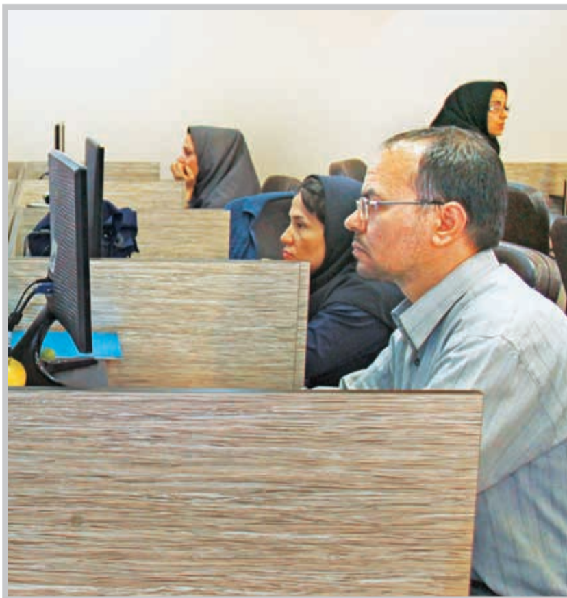
بیمه‌شدگان حوزه رسانه و مطبوعات با توجه به اینکه فاقد رابطه مزدگیری با مرجع معرفی کننده هستند مشمول بیمه‌بیکاری نمی‌شوند.

این گروه از بیمه‌شدگان ضمن دریافت دفترچه بیمه درمانی برای خود و تمامی افراد تحت تکفلشان از پرداخت فرانشیز در مراکز ملکی سازمان همانند بیمه‌شدگان اجباری معاف بوده