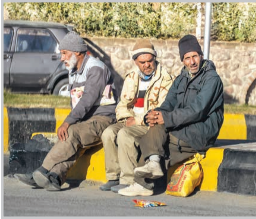
سوابقی که ۳ درصد حق بیمه به عنوان حق بیمه بیکاری از سوی کارفرما پرداخت شده در میزان مدت پرداخت بیمه بیکاری موثر است.

الف- زمانی که بیمه‌شده مجدداً اشتغال به کار شود که در این گونه موارد لازم است بیمه‌شده بلافاصله اشتغال خود را به آخرین شعبه دریافت مقرری بیکاری یا اداره کار محل کتبا اعلام کند در غیر این صورت سازمان تامین اجتماعی به محض اطلاع از اشتغال بیمه‌شده، مقرری وی را از اولین روز اشتغال قطع و سوابق ایجادشده را حذف و مبالغ اضافه دریافتی را از بیمه‌شده دریافت خواهد کرد. ب- مقرری بیکاری بدون عذر موجه از شرکت در دوره‌های کارآموزی یا سوادآموزی خودداری کند. ج- بیمه‌شده بیکار ضمن دریافت مقرری بیمه بیکاری، حائز شرایط استفاده از مستمری بازنشستگی یا از کارافتادگی شود یا اینکه فوت کند. د- بیمه‌شده به نحوی با دریافت مزد ایام بالاترین حقوقی به کار قبلی خود بازگردد.