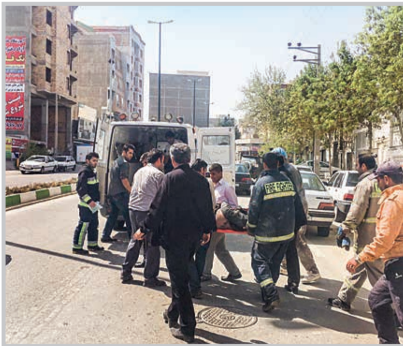
چنانچه حادثه ناشی از کار منجر به مصدومیت از کار افتادگی یا فوت کارگر ساختمانی شود، تامین اجتماعی تعهدات خود را در باره این دسته از کارگران انجام خواهد داد.

به‌جز بیمه‌شدگان تامین اجتماعی اضافه شوند. ضمناً حادثه ناشی از کار این گروه از بیمه‌شدگان در صورت وجود پروانه ساختمانی معتبر، کارت مهارت فنی و حرفه‌ای معتبر و برگه پرداخت حق بیمه با رعایت سایر ضوابط قابل بررسی خواهد بود.