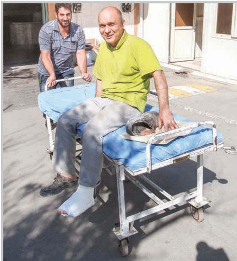
چنانچه وقوع حادثه با وظیفه شغلی بیمه‌شده‌ی ارتباط باشد یا ناشی از الزامات و مقتضیات کاری در معارف نباشد، حادثه ناشی از کار تلقی نمی‌شود.

است از: وجود رابطه بین کار موظف و حادثه‌ای که برای بیمه‌شده اتفاق می‌افتد. به‌طور کلی چنانچه وقوع حادثه با وظیفه شغلی بیمه‌شده بی‌ارتباط باشد یا ناشی از الزامات و مقتضیات کار وی در حد متعارف نباشد، حادثه ناشی از کار تلقی نمی‌شود. به‌عنوان مثال، اگر برای بیمه‌شده‌ای که شغلش در یک کارگاه خاص، رانندگی نیست، حین رانندگی که به‌دستور کارفرما نبوده است، اتفاقی بیفتد این حادثه ناشی از کار محسوب نمی‌شود.