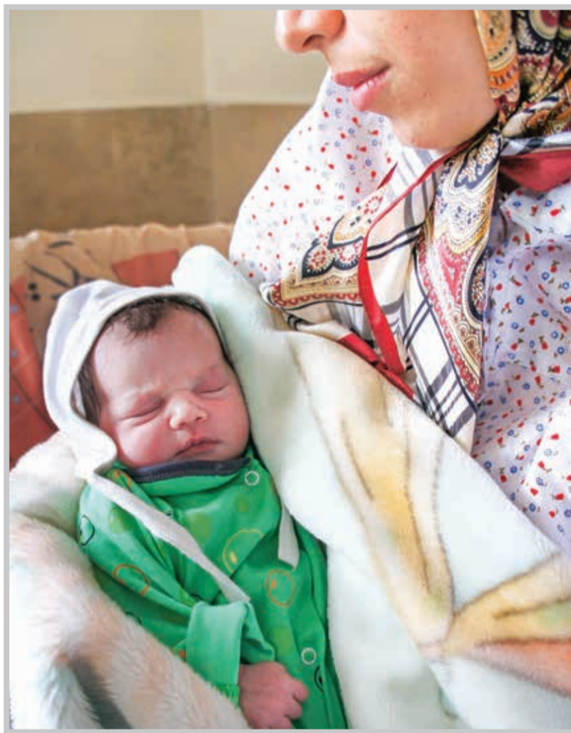
مدت مرخصی زایمان و شیردهی برای زایمان‌های یک و دو قلو از شش ماه به نه ماه افزایش یافته است اما...

به‌خاطر شیردهی پرداخت می‌شود. با توجه به عدم وجود شیردهی، در این حالت مرخصی زایمان بر اساس ماده ۶۷ قانون تأمین اجتماعی صرفاً به مدت ۱۲ هفته (۸۴ روز) در صورت احراز شرایط برابر مقررات پرداخت خواهد شد.