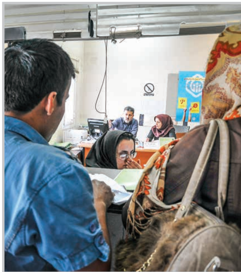
در صورت اثبات صحت اشتغال فرد در کارگاه، کارفرما باید حق بیمه ایامی را که حق بیمه آن را پرداخت نکرده است، برابر مقررات و با نرخ روز پرداخت کند.

تحصیل، ماهانه مبلغی به‌عنوان شهریه به آنان داده می‌شود، اگر حق بیمه یا کسور بازنشستگی از آن کسر و به یکی از صندوق‌های بازنشستگی (مانند صندوق بازنشستگی کشوری یا صندوق بازنشستگی نیروهای مسلح) واریز شود، در این صورت مدت مذکور به‌عنوان سابقه پرداخت حق بیمه محسوب می‌شود. چنانچه فردی پس از فراغت از تحصیل و قطع رابطه استخدامی (مانند استعفا، اخراج، بازنخرد، انقضا، اتمام قرارداد...) با محل خدمت مورد تعهد خود یا تغییر وضعیت استخدامی یا انتقال به دستگاه دیگری به هر طریق بیمه‌پرداز