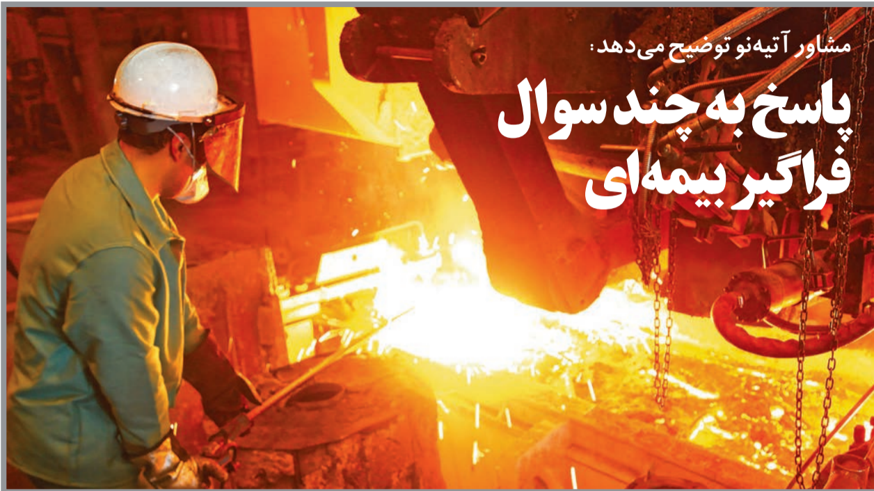
کارفرمایانی که بیمه کردن کارکنان خود امتناع کنند و ماده ۱۴۸ را اجرا نکنند، علاوه بر تادیبه کلیه حقوق متعلق به کارگر (سه‌م کارفرما) با توجه به شرایط محکوم به پرداخت جریمه نقدی خواهند شد

کارکنان خود امتناع کنند و ماده ۱۴۸ را اجرا نکنند، علاوه بر تادیبه کلیه حقوق متعلق به کارگر (سه‌م کارفرما) با توجه به شرایط و امکانات خاصی و مراتب جرم، به جریمه نقدی معادل دو تاده برابر حق بیمه مربوطه محکوم خواهند شد. جرائم نقدی مقرر در این ماده به موجب ماده ۱۸۶ قانون کار به حساب مخصوصی در بانک واریز می‌شود و این وجوه تحت نظر وزارت کار جهت امور رفاهی، آموزشی و فرهنگی کارگران به مصرف خواهد رسید و برای شکایت‌کننده نفی در بر ندارد، یعنی مبلغ مزبور به حساب دولت واریز می‌شود بنابراین این نوع شکایت خیلی نادر است و کم اتفاق می‌افتد و فقط به منظور تحت فشار قرار دادن کارفرما انجام می‌پذیرد. اما موضوع کفبری در مورد این شکایت مطرح نیست فقط جریمه‌ای معادل دو تاده برابر برای کارگر در نظر گرفته می‌شود. ولی از آنجا که شکایت بابت مواد ۱۷۱ تا ۱۸۴ قانون کار طبق ماده ۱۸۵ قانون در صلاحیت دادگاه‌های کفبری دادگستری است چنین استنباط می‌شود که تمامی جرائم مربوط به این مواد جنبه کفبری دارند. در واقع به دلیل آنکه اغلب مواد مذکور از قبیل مواد ۱۷۹، ۱۷۸، ۱۷۷، ۱۷۵، ۱۷۶ و ۱۸۱ حیس را به عنوان مجازات در نظر گرفته‌اند و حبس جزء مجازات‌های کفبری است، از این رو محل و مرجع طرح کلیه شکایات در دادگاه‌های کفبری تعیین شده است. در ماده ۱۸۳ فقط جریمه برای خاطی در نظر گرفته شده و موضوع حبس در این ماده قانونی مطرح نشده است.