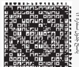
رمز: بیمه عکاسان