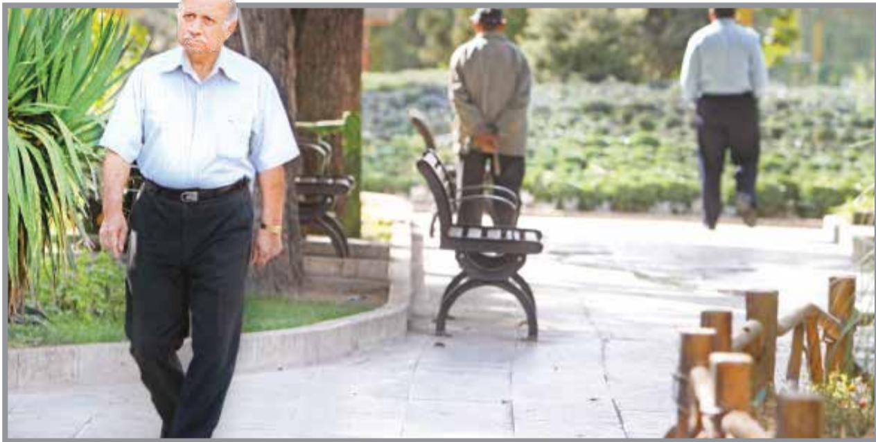
در ماده ۳۱ قانون برنامه پنجم توسعه (این قانون تا پایان سال ۹۵ تمدید شده است) تصریح شده که در صورت افزایش غیر متعارف دستمزد مبنای کسر حق بیمه در دو سال آخر، مدت مبنای محاسبه مستمری از دو سال به ۵ سال افزایش می‌یابد