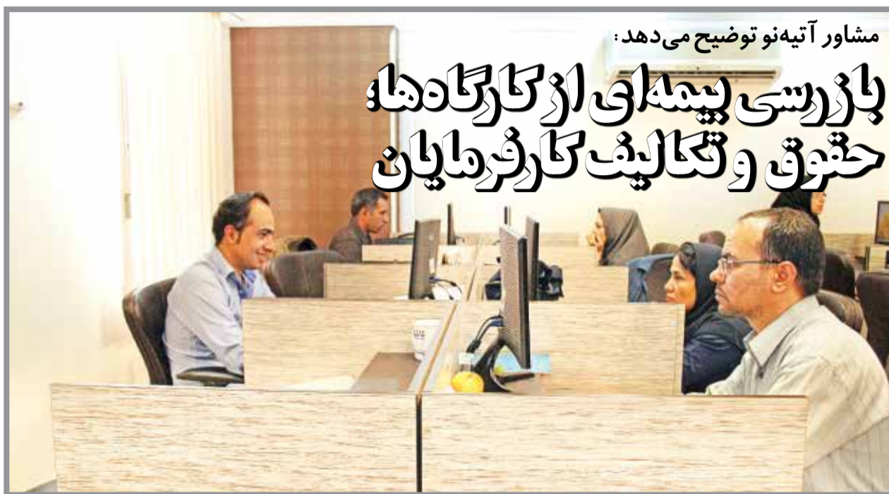
کارشناس تامین اجتماعی