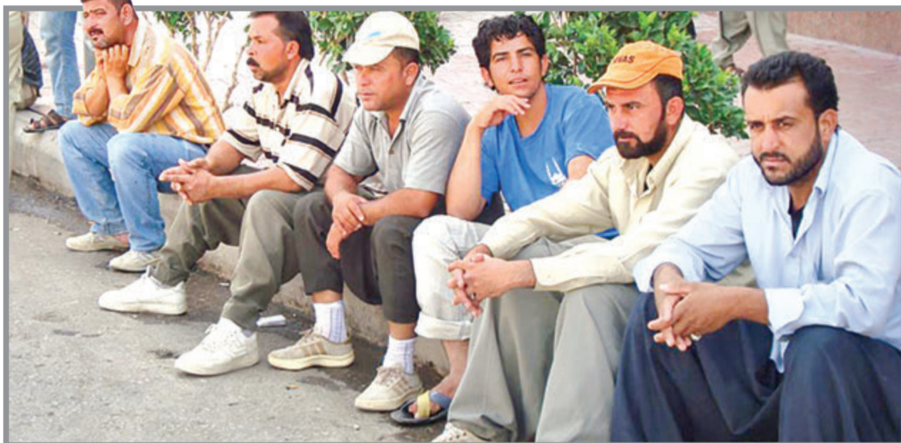
بیمه اختیاری به منظور تداوم پرداخت حق بیمه تا رسیدن به شرایط استفاده از خدمات بلندمدت سازمان تامین اجتماعی از قبیل بازنشستگی و از کارافتادگی یا مستمری فوت به وجود آمده و برای انعقاد آن نیاز به ۳۰ روز سابقه قبلی در سازمان تامین اجتماعی است