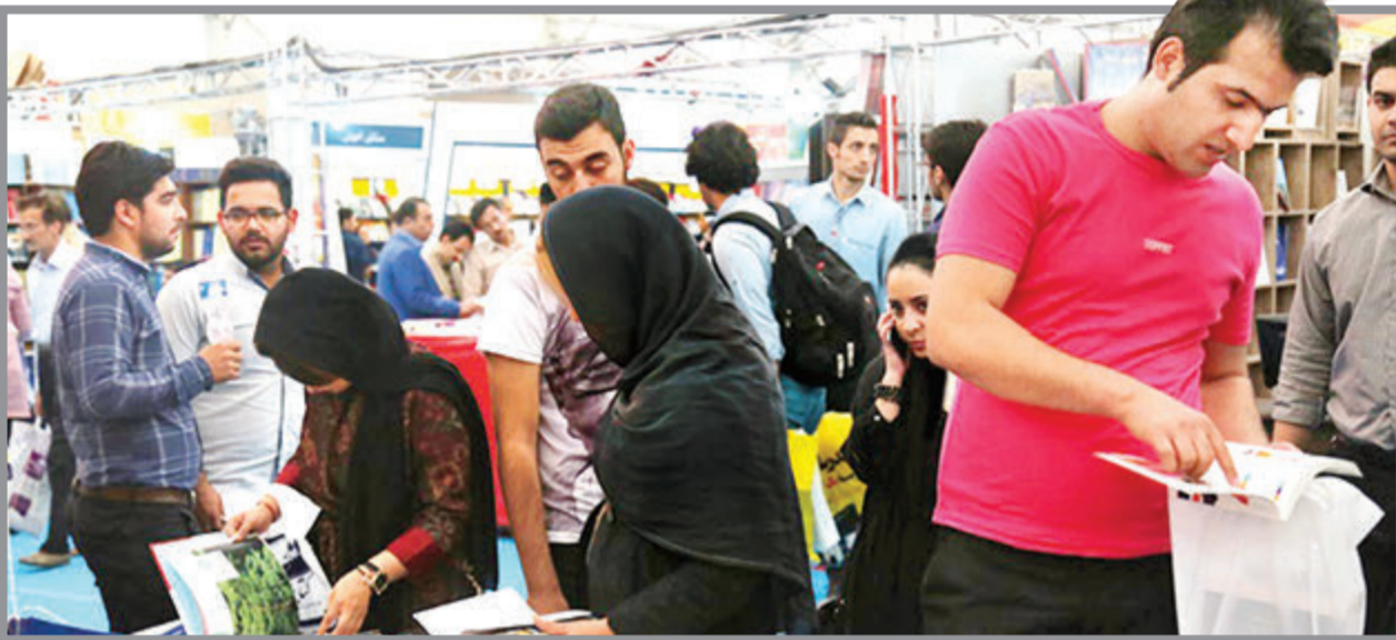
درصد حق بیمه پرداختی نویسندگان و هنرمندان ۱۸ درصد است که ۸ درصد آن را (بالغ بر ۶۵ هزار تومان در ماه) شخص بیمه‌شده و ۱۰ درصد را هم دولت (وزارت ارشاد و فرهنگ اسلامی) می‌پردازد