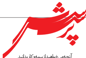
آنجمی خواهید از بیمه و کار بداند

یکی از دغدغه‌ها و مشکلات سازمان‌های بیمه‌ای ناشی از ناآگاهی و اطلاعات ناکافی کسانی است که از خدمات این سازمان‌ها استفاده می‌کنند. استفاده از مشاوره کارشناسان بهترین راه برای رفع این مشکل و صرفه‌جویی در هزینه و وقت است. «پرسش» جایی است که شما می‌توانید سوالات مرتبط با بیمه، حقوق و مقررات کار و همچنین مشکلاتی که احیاناً در جریان مراجعه به شعب تامین اجتماعی با آن روبرو شده‌اید را با مشاوران هفته‌نامه آتیه‌نو در میان بگذارید و پاسخ آن را در همین صفحه بخوانید. برای این منظور می‌توانید سوالات خود را از طریق ایمیل mohamadghashghai@yahoo.com برای ما ارسال کنید و یا به آدرس دفتر نشریه که در شناسنامه صفحه آخر قید شده است، بفرستید.